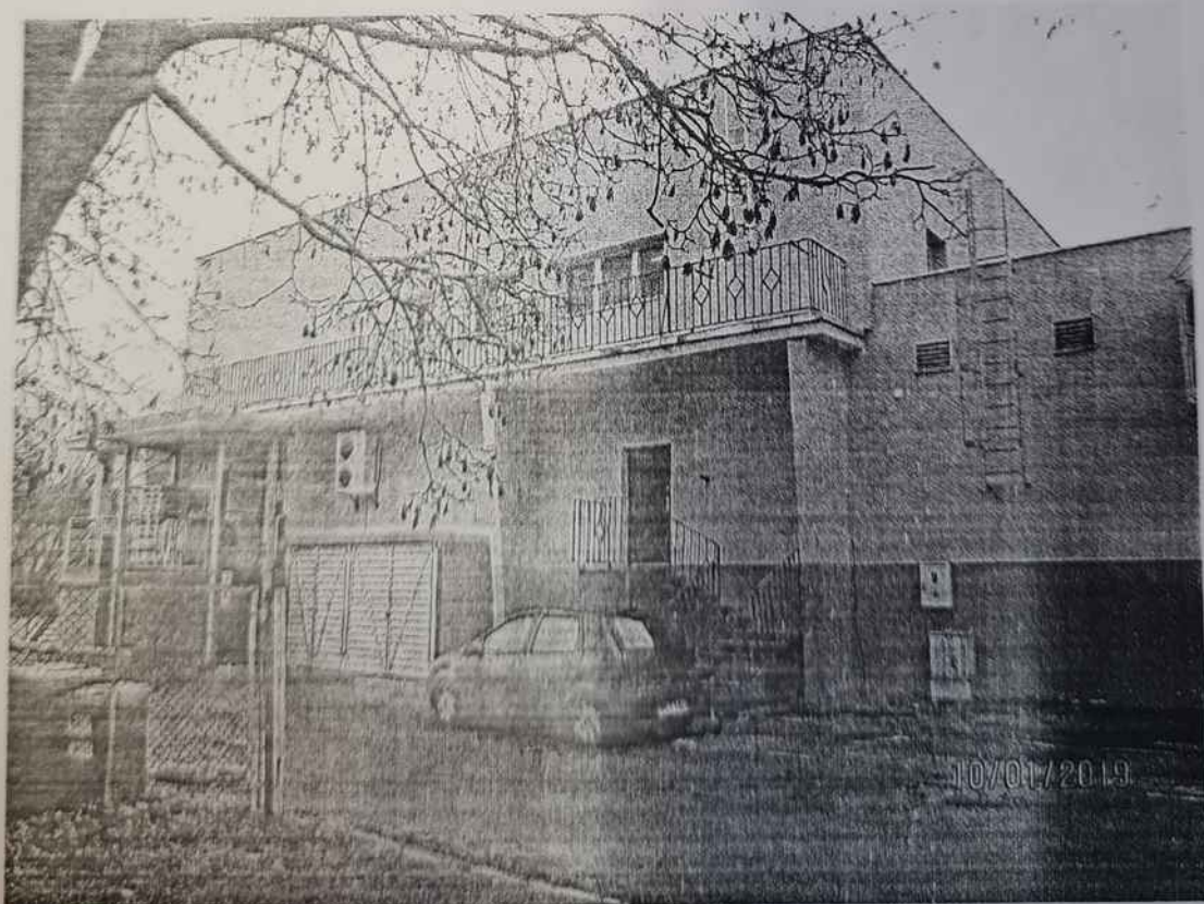
Fot.4. Widok budynku od strony północnej.